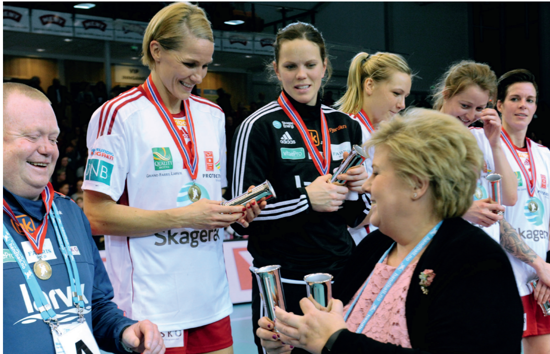
Larvik HK mottar NM-gull levert av bk.no av statsminister Erna Solberg i 2015.