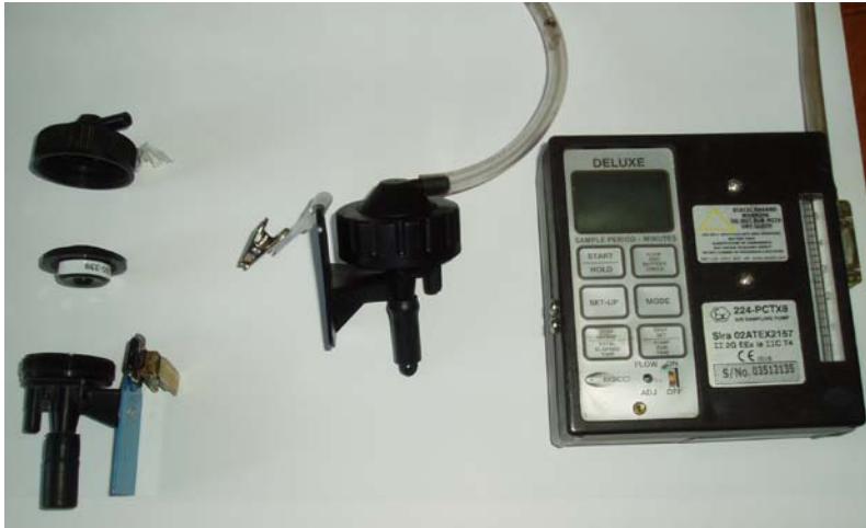
Figur 3. Prøvetakingsutstyr. Til venstre vises en demontert sykklon med prøvekassett m/filter i midten. Til høyre vises en montert sykklon med slange påkoplest sykklonens innsug og med en slange tilkoblet støvpumpens innsug.

Figur 3 viser et prøvetakingsutstyr med sykklon for respirabel støvfraksjon. Den avbildede pumpen har et rotameter for justering av gjennomstrømmingen i pumpen, men ofte brukes også et separat rotameter eller en elektronisk gjennomstrømningsmåler til dette formålet.